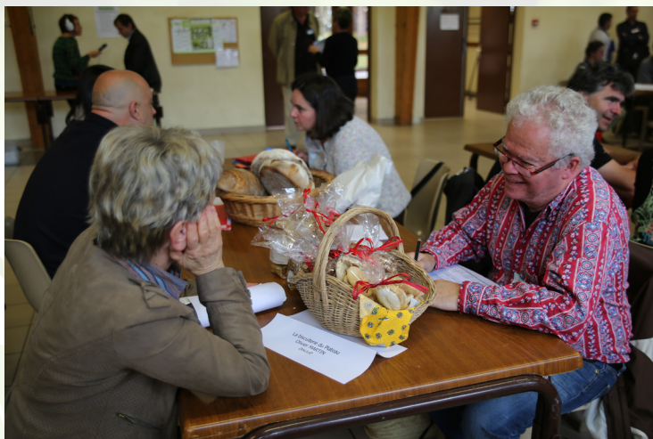
Des entretiens individuels autour de dégustation se sont concrétisés pour certains par des commandes

Autour de dégustations, les producteurs et acheteurs ont pu évoquer les modes de production (pratiques, saisonnalité, ...), les prix mais aussi les contraintes sur les volumes attendus.