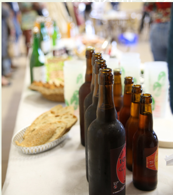
Un buffet agrémenté de produits locaux a clôturé ces rencontres

Si l'objectif de ces rencontres n'était pas de répondre à la totalité de la demande des professionnels, ces échanges ont permis à certains acheteurs de tester de nouveaux produits - commandes ont été passées notamment pour des événements ou encore pour des essais dans les commerces ou cantines. Devant les volumes annoncés par la restauration collective notamment, les producteurs ont à nouveau noté l'importance de mieux se structurer et l'intérêt de se faire connaître.